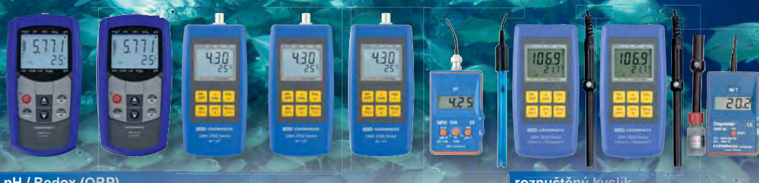
pH / Redox (ORP)